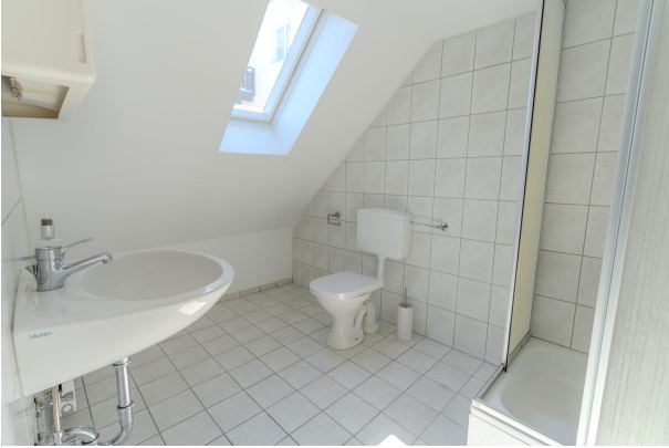
2. OG Wohnung Bad