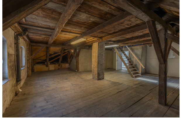
2. OG Ausbaupotenzial