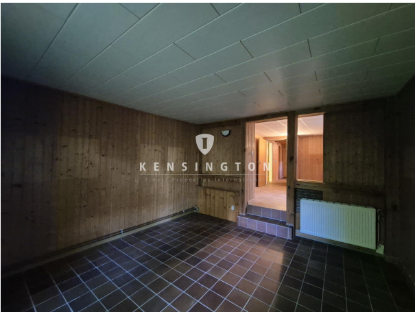
Treppe zum Keller