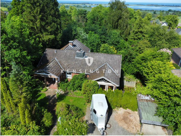
Hausansicht von oben