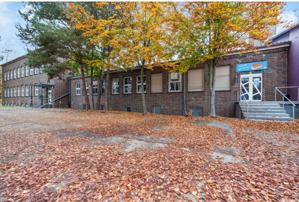
Gebäudeansicht von der Seite