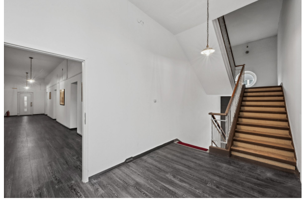
Treppenaufgang im 1. OG